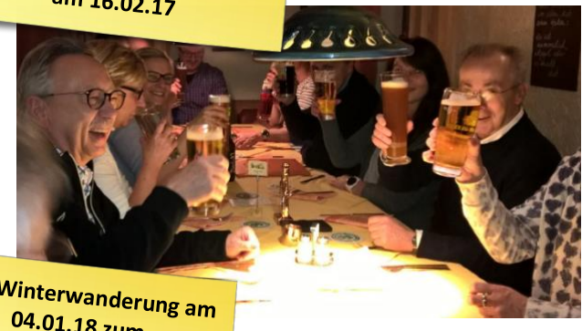
BBG-Winterwanderung am 04.01.18 zum Gasthaus Hubert