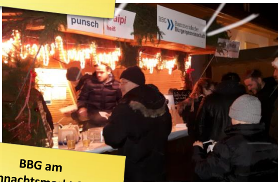
BBG am Weihnachtsmarkt 2017 auf Schloss Jägersburg