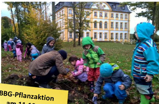
BBG-Pflanzaktion am 11.10.17 mit dem Kindergarten