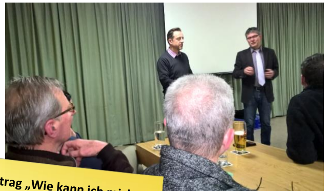
Vortrag „Wie kann ich mich vor Einbrüchen schützen“ am 16.02.17